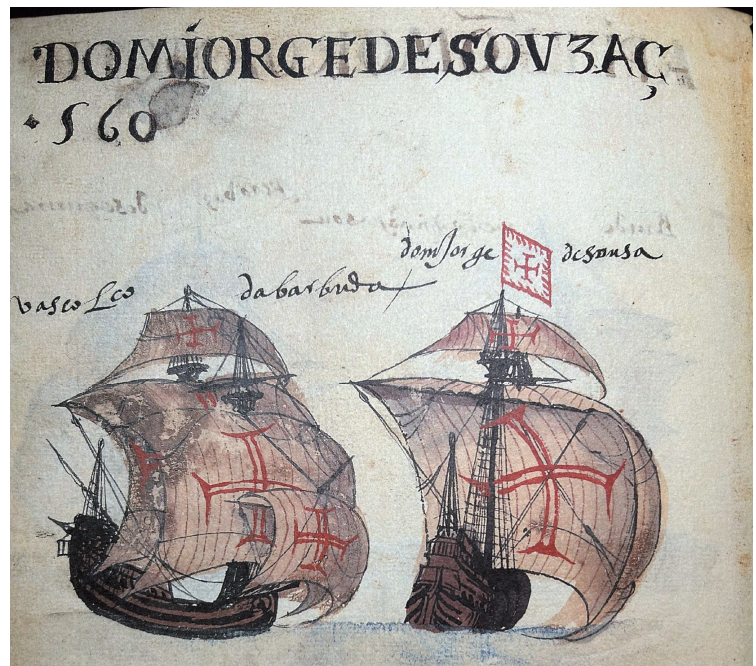
リズアルテ・デ・アブレウによる1560年のインド航路のナオ船の図

オリヴェイラは波乱に富む生涯を過ごしたが、晩年に「建造の書」を著し、その自筆本がリスボンの国立図書館に保存されている。その内容は、船の設計が中心ではあるが、木材、瀝青(黒船の名称の由来)等にはじまり、船の建造に関して広範に及んでいる。文章は明快であり、また何枚もの図面が挿入されている。