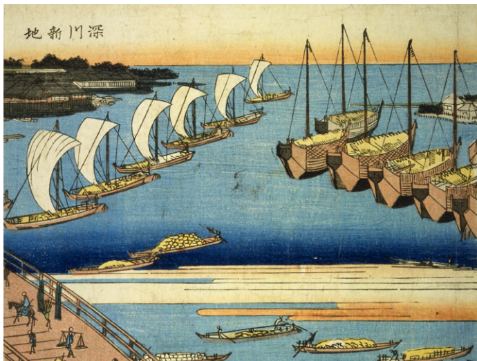
一立斎広重『東都名所永代橋全図』(部分)